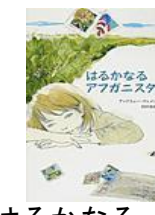
はるかなるアフガニスタン