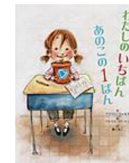
わたしのいちばんあこの1ばん