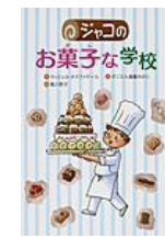
ジャコのお菓子な学校