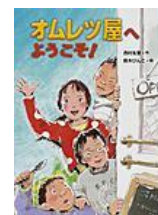
オムレツ屋へようこそ!