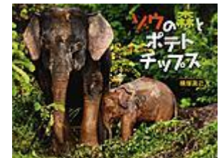
ゾウの森とポテトチップス