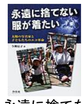
永遠に捨てない服が着たい