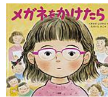
メガネをかけたら