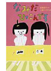
なみだひっこんでろ