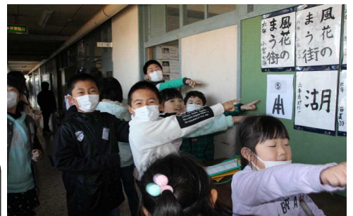
校内ウォークラリーで遊ぶ