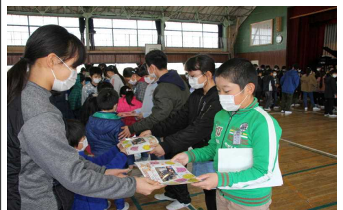
下級生(左)から6年生へ贈り物