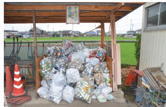
校舎北側・自転車置き場にある集積場

今年もボランティア委員会の5・6年生が、毎週水曜日にアルミ缶の回収活動を行っています。地域の皆様からも大量のアルミ缶が本校に届いています。昨年は、約460kgのアルミ缶が集まりました。数にしておよそ2万3千個です。空き缶・空き瓶専用のゴミ袋に換算すると約200～230袋になります。改めて、地域の皆様が本校の教育を、如何に支えてくださっているかがわかります。本当にありがとうございます。