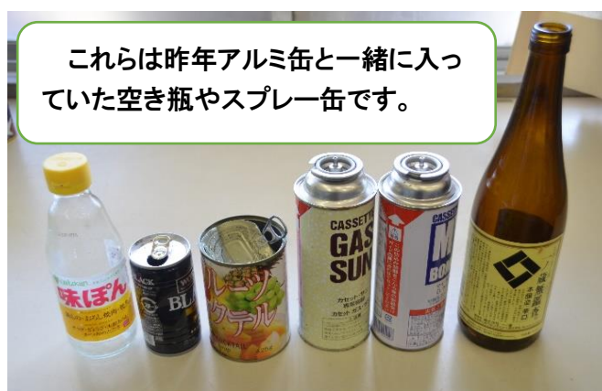
これらは昨年アルミ缶と一緒に入っていた空き瓶やスプレー缶です。