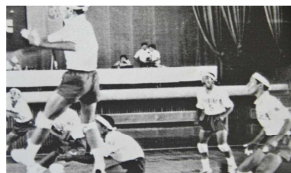
中学3年生の私[右から二人目]

1学期は休校が多くて、友だちや先生とすごす時間が少なかったの、さびしかったです。宿泊学習では、長い時間みんなとすごすことができるので、その時間を大切に、すてきな思い出をたくさん作りたいたいです。