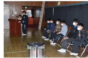
感謝の会を進める給食委員会

僕達6年生も、もうそろそろ卒業の時期ですが、この学校の大切な思い出として、楽しかった給食の時間を忘れることはありません。僕達のために心をこめて給食を作ってください、本当にありがとうございました。