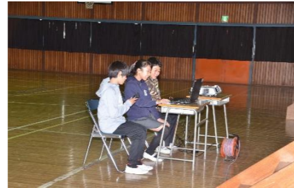
PCを使って大型スクリーンに、栄養士と6人の調理員の皆さんを紹介。