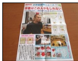
えいがいい ↑ 映画以外のポスター