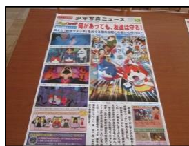
えいが ↑ 映画のポスター