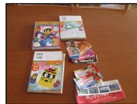
ほん ↑ 本のふろく、帯など、色々あります