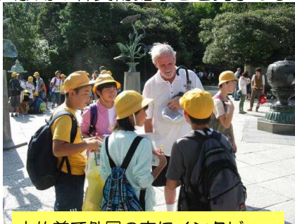
大仏前で外国の方にインタビュー