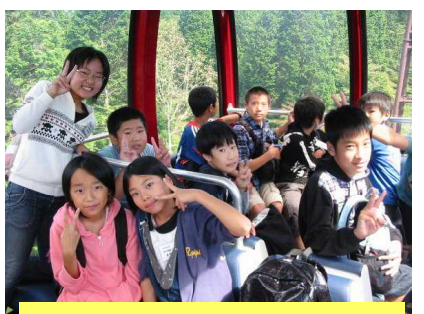
ケーブルカーで記念撮影です