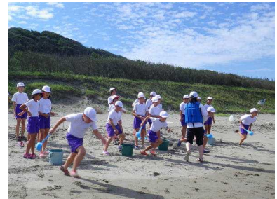
砂浜活動(海水リレー)