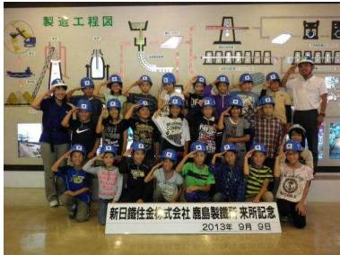
新日鉄住金鹿島製鉄所見学

鹿島製鉄所見学や自然の家での活動を無事実施できました。子ども達は、約束をよく守りけがや病気になる人が一人もいませんでした。すばらしい宿泊学習になりました。