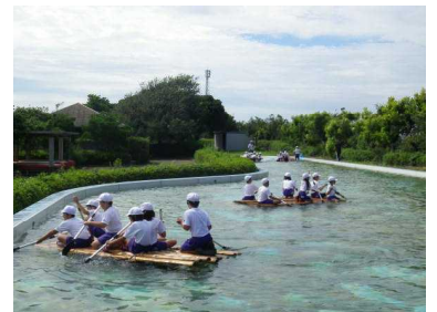
いかだ乗りに挑戦です