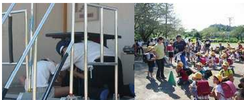
9月18日(水) (避難訓練、引渡し訓練)

起震車による地震体験を行い、引渡し訓練では、昨年の反省を生かし短時間で終わることができました。