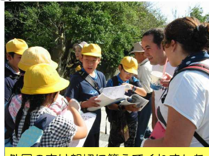
外国の方は親切に答えてくれました