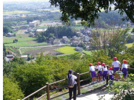
9月20日(金) (2年生 しろやまに登ろう)

起震車による地震体験を行い、引渡し訓練では、昨年の反省を生かし短時間で終わることができました。