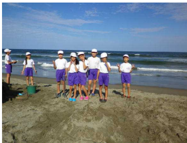
砂の造形(傑作ができました)