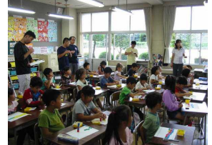
9月25日(水) (1年算数 24を正しく速く数えよう)

学校から歩いてしろやまに登り、皆川地区の広さを目で確認し、学校が見えて、児童は歓声を上げていました。