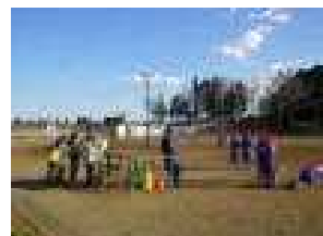
野球の試合を見学