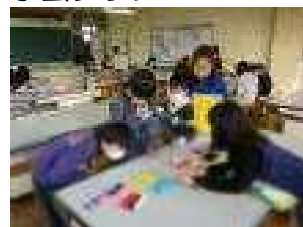
制作した作品を鑑賞 運動クラブ