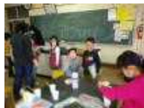
スライム作りを見学 パソコンクラブ