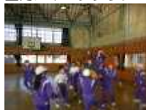
ポートボールの様子を見学 科学工作クラブ