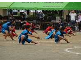
皆城小恒例のよさこいソーラン