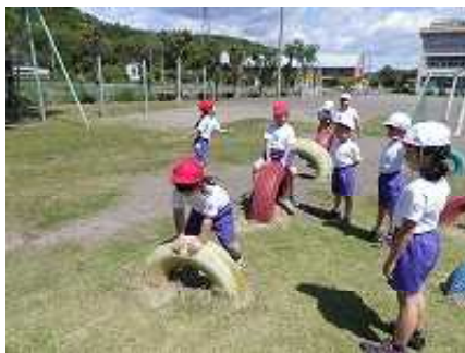
5月7日(火) (1年 2年生と遊んだよ) 2年生と一緒に遊びました。最後にアサガオの種を2年生からもらいました。