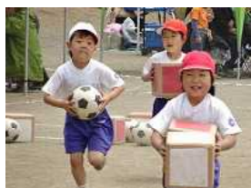
お土産を持ってゴール

新緑がまぶしくすがすがしい季候の中、5月25日（土）に運動会を無事実施することができました。当日は、たくさんの保護者の皆様にご参観いただきましてありがとうございました。5月に入ってから、子どもたちは一生懸命に練習や準備をして、当日は競技、演技、係活動に一生懸命に取り組んで、赤・白の勝敗も最後まで分からない白熱した展開になりました。結果は、『白組』が平成19年度以来の優勝で幕を閉じました。