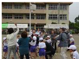
1年生と一緒に玉入れ