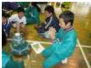
ペーパークラフト