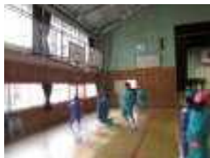
ミニバスケットボール

第2回目は、前回立てた計画の 実践 です。体育館、校庭、理科室、家庭科室、教室、 学校全体 を使って いろいろな活動が展開 されました。全部で15活動が行われました。