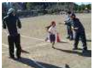
↓ Bコース続々とゴール