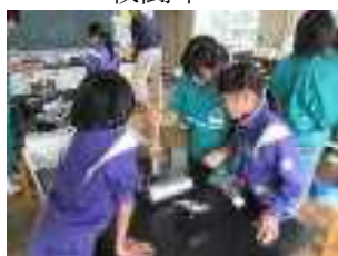
べっこう飴づくり