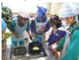
ホットケーキづくり