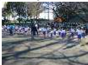
↑ Aコーススタート前の様子