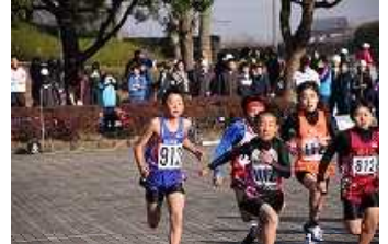
各友好レースのスタート