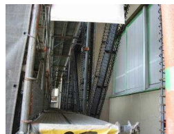
筋交いの中は鉄筋が入っています

6月25日から行っていた、校舎の耐震工事が終了しました。北側外壁に鉄筋コンクリートの筋交いがついていますので、来校の折見ていただければと思います。この後、体育館の耐震工事が始まります。引き続きご不便をおかけしますが、よろしくお願いいたします。