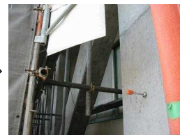
コンクリートで固めました