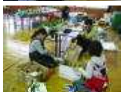
←朝取り野菜の値付け バザーは大盛況でした。 子どもたちの集まりが早く、ゲームコーナーは予定を30分繰り上げて開始。