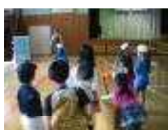
←ストラック アウト