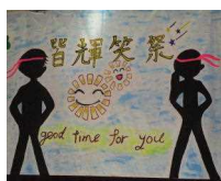
【皆中祭スローガン】

その後、B班の演劇「Alice～世界がアリスの夢だったら～」、発表Ⅱ部では、C班による琴・和太鼓の演奏、有志によるダンスや歌を楽しみました。実行委員の活躍を見学したり、各学年が授業や行事等を通して作成した展示物を見学したりして過ごしました。昼食は、PTA運営委員の方々にご協力頂き委託販売で実施することができました。フィナーレでは、全校生徒が輪になってテーマソングを歌いました。コロナ・インフル対策を取りながら、学校運営協議会委員の皆様、昨年度まで本校に勤務していた先生方、保護者の皆様にも参観していただき、可能な限り生徒の様子を見て頂きました。コロナ禍のため、ここ数年にはないくらいたくさんの方々にご足を運んでいただきましたことに感謝申し上げます。大変お世話になりました。全校生徒の「楽しそうな表情」に感動し、癒やされた行事になりました。