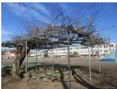
（きれいになった藤棚）

16日（日）に整美部の皆様には、藤棚を中心に樹木の剪定を行っていただきました。また、おやじの会の皆様には、廊下のセンターライン（白線）の貼り替えを行っていただきました。それぞれ見違えるようにきれいになりました。お忙しいところ、環境整備にご協力いただきありがとうございました。お陰様で、子供たちは気持ちよく学校生活を送ることができます。