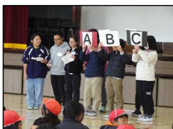
栽培福祉委員会のクイズ