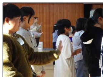
「ありがとうの花」全校合唱