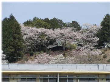
学校から眺めた大宮神社

今年は4月当初の天候の影響で、桜の花が長く楽しめております。本校を見守るかのように鎮座される大宮神社の桜も、学校から鮮やかに見ることができました。