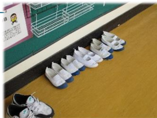
早速、実践されていた靴そろえ (4月9日(水)身体計測にて)

今年度も、毎学期、皆さんに振り返りをしてもらいます。1年間、頑張してほしいことを意識しながらみんなで楽しく学校生活を送りましょう。