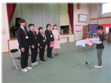
児童代表による歓迎の言葉

教職員の定期異動に伴い、ALTの先生も含め7名の先生方とお別れをし、新たに6名の先生方を迎え入れまし