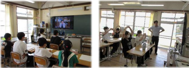
“あったか栃木” いじめ防止子どもフォーラム

は思わないで言ってしまったことが、言われた相手が悪口だと思ってしまうかもしれないので、相手が傷ついてしまうかもしれないことは言うてはいけない。」「言葉はナイフにもなる。言葉をナイフにするのではなく相手が喜ぶ言葉にすればみんなが幸せになれる。」「いじめをなくして楽しい学校にしたい。」などといった感想を持つことができました。