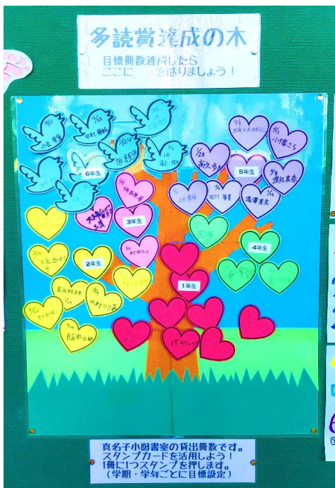
【図書室廊下の多読賞の木】