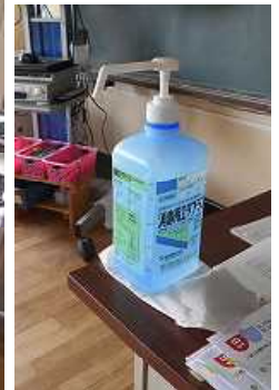
教室には消毒スプレー