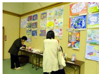
作品展示コーナー