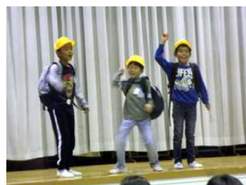
ぼくたちは探検隊（3年生）