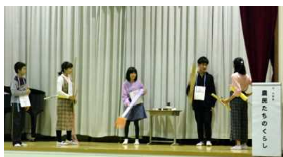
農民たちの暮らし（6年生）