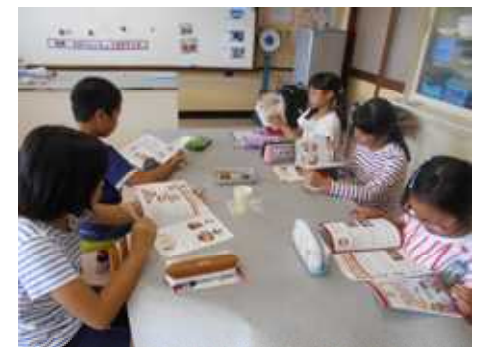
もろみ・生醤油・醤油を味くらべ