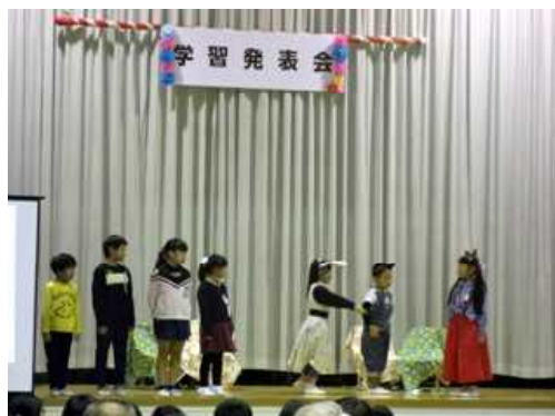
がっこうだいすき 1年生！