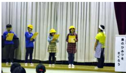
魚のひみつをさぐる（5年生）