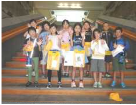
3・4年生 栃木県庁正面階段