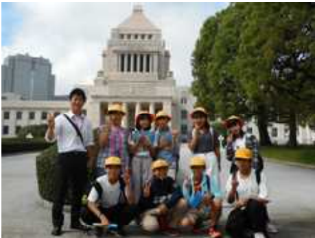
6年生 国会議事堂前

6年生は東京へ、4年生は宇都宮と益子へ、3年生は宇都宮へと出かけました。それぞれ国、県の中枢機関を見学してきました。政治や行政には関心が薄くなりがちですが、子どもたちの未来にとっても大切なことです。この学びの機会を大切にしていかななくてはならないと思います。