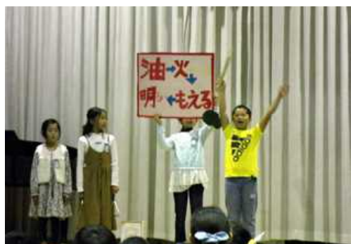
大中寺ミステリー（4年生）