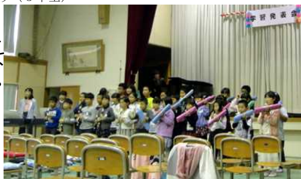
全校児童による合奏 『Circle of Life』