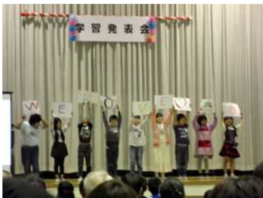
WE LOVE 西方！（2年生）