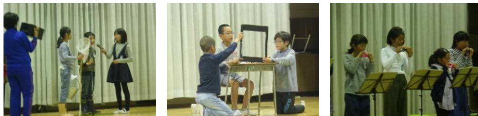
一生懸命練習した成果を発揮することができました。