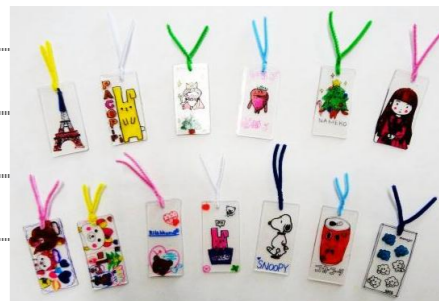
図書委員さんの手作り