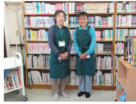
写真① プレゼント贈呈