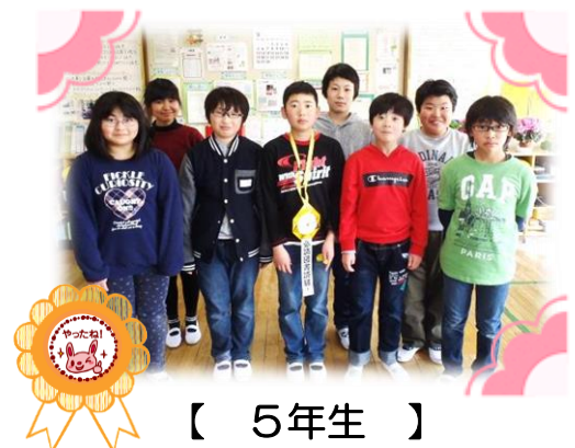
【 5年生 】