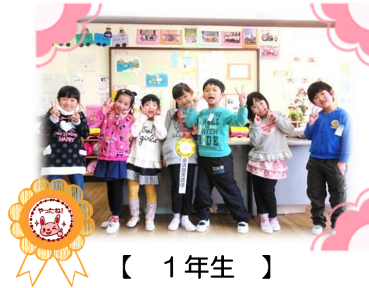
【 1年生 】