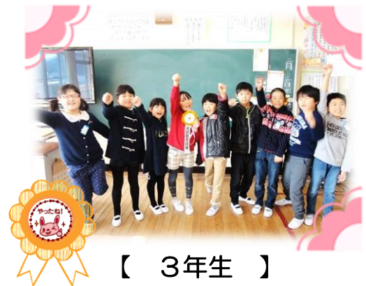
【 3年生 】