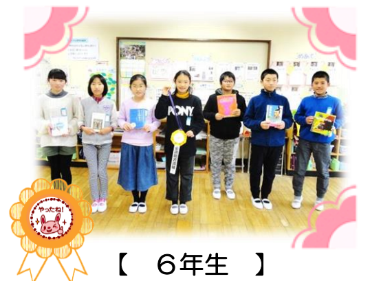
【 6年生 】