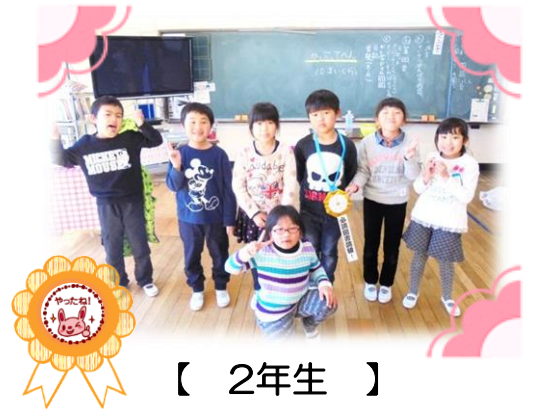
【 2年生 】