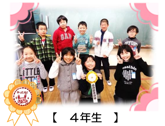
【 4年生 】