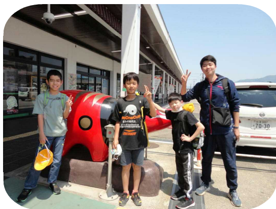
【赤べこの前で】 みんなで記念写真