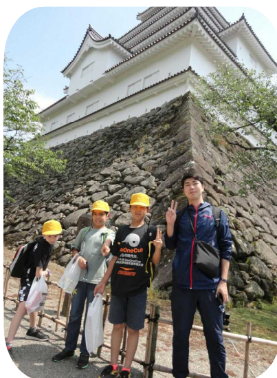
【鶴ヶ城の見学】 大きくて、とても立派なお城でした。頑丈な石垣にもビックリ！ 市内を走るバスに乗って、見学場所を巡りました。