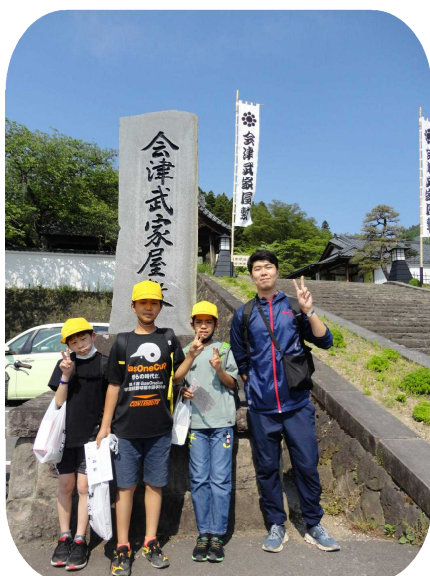
【武家屋敷にて】 会津藩の家臣達の忠誠心の強さに驚きました！昔のトイレにも～