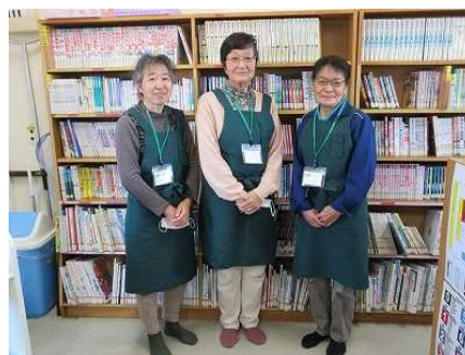
写真③ かつぱに〜らの皆さん