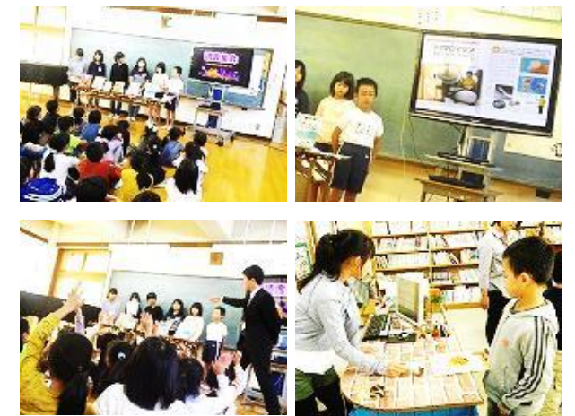
読書集会の様子と終わった後の図書室の様子です。図書委員さんが紹介した本を早速借りていく児童。