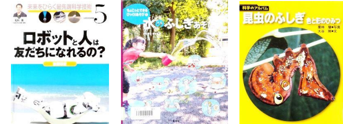
【読書集会で紹介した本】

今年もブックトークに挑戦しました。ブックトークとは、テーマを決め、それに沿って本を紹介していく方法です。ブックトークでは「その本読んでみたい！」と思わせる紹介文を作るので、ちょっと工夫が必要です。図書委員さんは、休み時間も自主的に図書室に来て、修正しながら原稿を作りました。