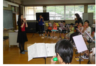
【未来学習（日本文化や英語の文字に親しませる学習等）】【個を伸ばすサマースクール】【プロ等に学ぶクラブ活動】