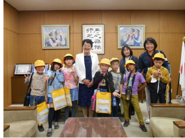
【市長さんと記念撮影】

社会科の学習で、市役所・山車会館・栃木駅に見学にいきました。市役所で働く人々を間近に見て、どんな仕事をしているのか説明を聞きました。市長さんやとち介と記念写真を撮っていただいたり、山車会館で映像を見たりし、学習を深めることができました。