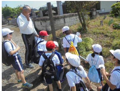
←千手観音についての話を聞く (中村良一氏解説)