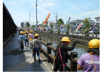
【巴波川のこいのぼり】