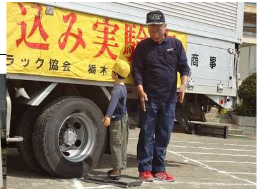
上：トラックを使って実験