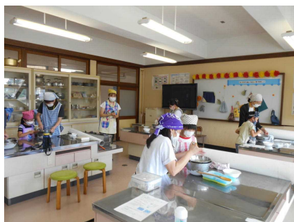
第2学年PTA活動 (アイス作りクリーム)