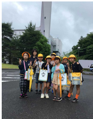
みんなで記念撮影