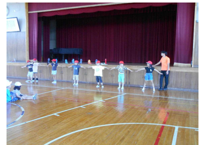
おにごっこで楽しく遊ぼう！