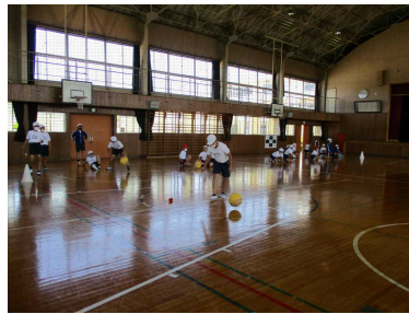
思わずあせるドリブルリレー

西方ブロック小中一貫教育活動のひとつである6年生の合同授業を行いました。本校の6年生が、西方小学校に出向き、体育や国語の授業を一緒に行いました。体育では、ドリブルリレーや、ボールを使った運動で汗を流しました。国語は、「たのしみは」で始まる俳句を作って読み合い、感想などを交換しました。みんなで仲良く取り組んでいました。