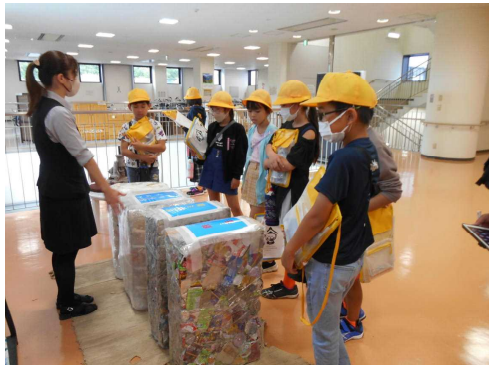
圧縮された空き缶やペットボトル

また、菌部浄水場では、きれいな水を作るしくみを知り、当たり前で飲んでいる水が、多くの人々の働きにより作り出されていることがわかりました。どちらの見学でも、積極的に質問し、理解を深めていました。