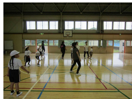
第3学年PTA活動 (ドッジボール)