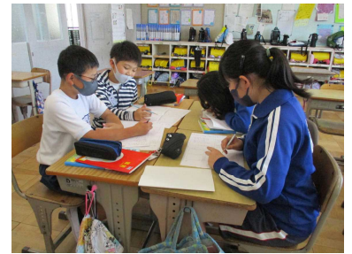
それぞれのたのしみがあっておもしろい！