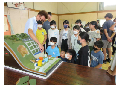
崖崩れとは・・・