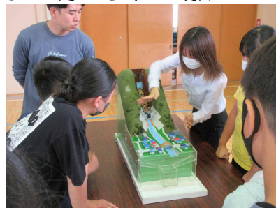
土石流を模型を使って再現！

◀ 不審者に遭ったときにどうすればいいのか、紙芝居を使って具体的にお話してくださいました！