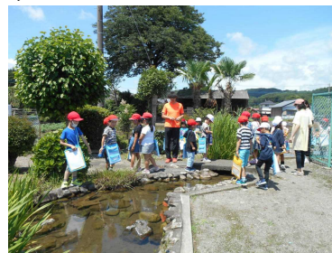
どんな生き物がいるかな？

また、体育館でおにごっこをしたり、「もうじゅうがりにいこうよ」という遊びをしたりして、一緒に楽しく過ごしました。