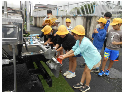
災害時用の水道の水を飲んでみる