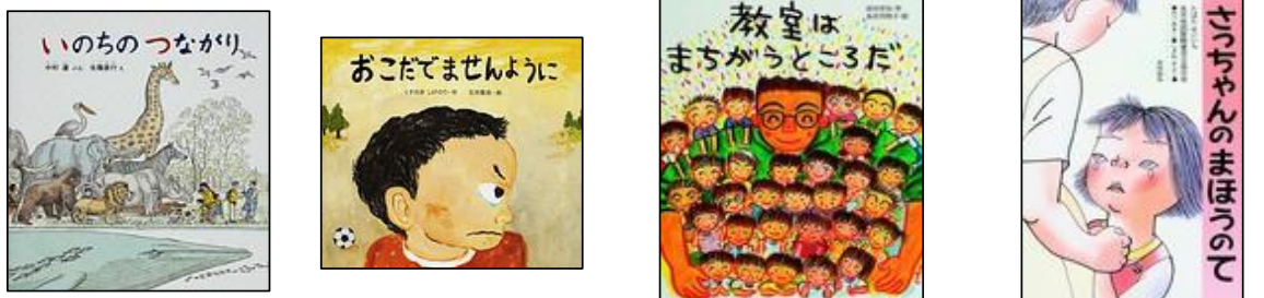
【いのちのつながり】 【おこだでませんように】 【教室はまちがうところだ】 【さっちゃんのまほうのて】