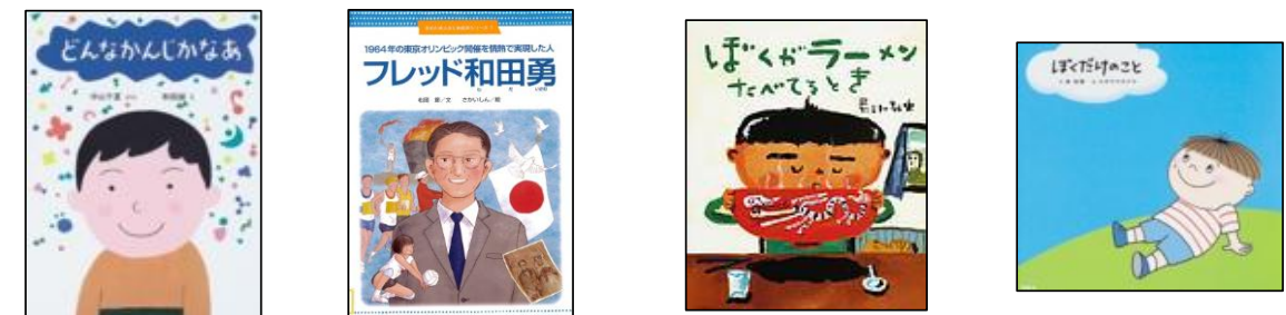
【どんなかんじかなあ】 【フレッド和田勇】 【ぼくがラーメンたべてるとき】 【ぼくだけのこと】