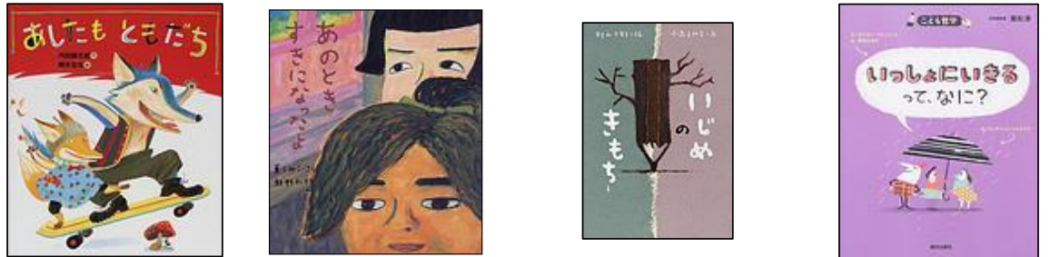
【あしたともだち】 【あのとときすきになったよ】 【いじめのきもち】 【いっしょにいきて、なに？】