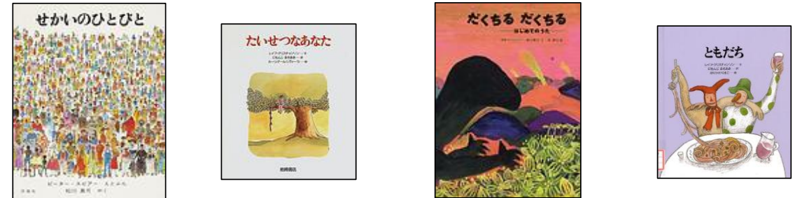
【せかいのひとびと】 【たいせつなあなた】 【だくちる だくちる】 【ともだち】