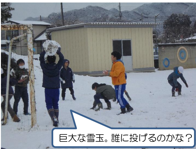
巨大な雪玉。誰に投げるのかな？