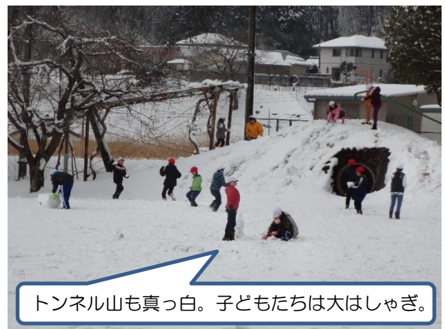
トンネル山も真っ白。子どもたちは大はしゃぎ。