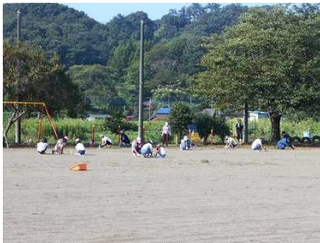
①夏の間に茂った草をみんなで除草

夏休みの終わりに、2週続きの日曜日作業でした。ご協力くださった地域の皆様、保護者の皆様、ありがとうございました。2学期を迎える準備が大きく進みました。また、資源ゴミ回収の収益金は子どもたちのために活用させていただきます。