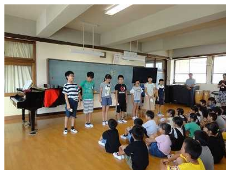
5年生が2学期のめあてを発表