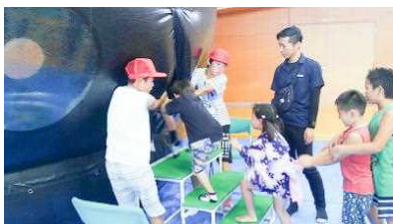
会場ボランティア