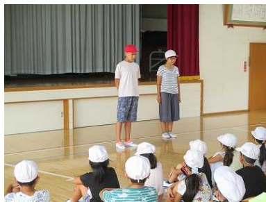
紅白の団長が意気込みを発表

9月28日の運動会に向けて、各学年とも練習が始まりました。体育の授業以外にも、業間や昼休みは応援団や全校ダンスの練習に費やしています。また、9月9日真名子っ子タイムには、決起集会にあたる児童集会が開かれ、紅白各組の団長から運動会への意気込みが語られました。日々の練習は本番のつもりで、今そのときを全力で頑張ります。