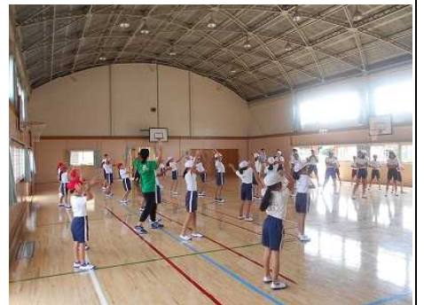
業間に全校そろってダンスの練習