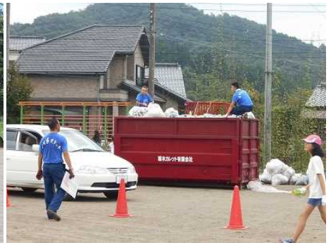
②コンテナからあふれそうなアルミ缶