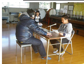
【11月13日の録音の様子】

＜発表者＞ 4～6年生 ＜放送日＞ H25. 11. 20～ H26. 1. 6の月～金 ＜時間＞ 12時50分～ (一日一ずつ、2分程度)