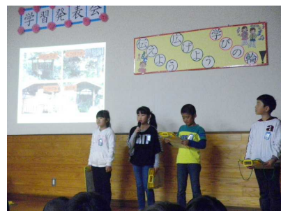
【3年：真名子よいところ探検隊】