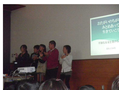
【6年：平和な未来が築けるように】