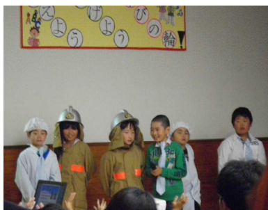
【2年：真名子ニュース】