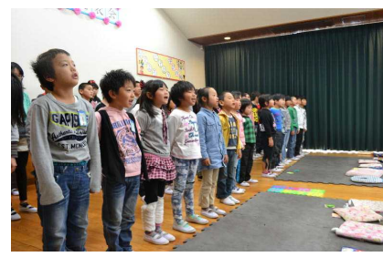
【全校群読「心に太陽を持って」】

お忙しい中、子どもたちの発表を最後まで見てくださりありがとうございました。また、事後アンケートもお世話になりました。その中で、ある保護者の感想に私たち教職員も元気をいただきました。