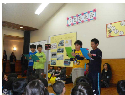
【5年：今求められている自動車】