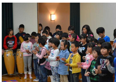
【全校合奏：サモア島のうた】