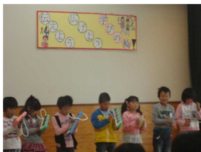
【1年：合奏ミッキーマウスマーチ】

11月9日（土）、夢ホールで学習発表会が行われました。今年の学習発表会のテーマは「伝えよう、広げよう、学びの輪」です。これまで地域の方々にお世話になったり、保護者の皆様にも励ましていただいたりしながら学習してきたことを、一生懸命練習し、精一杯発表しました。皆様から大きな拍手をいただき、子どもたちは充実感を味わい、大きな自信を得ました。