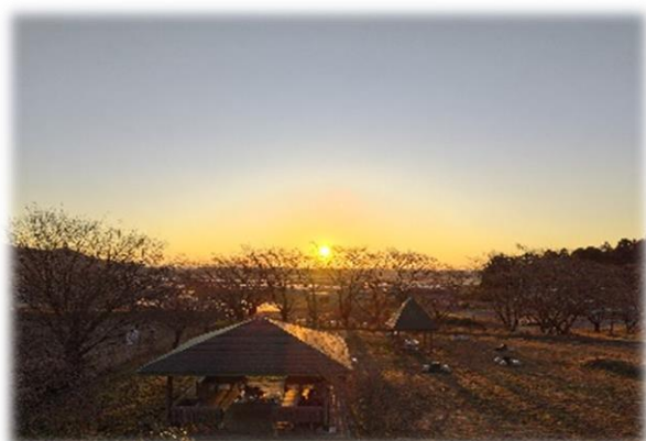
令和7年 初日の出 (栃木市大平町 かかしの里にて)

各学年とも、令和6年度の有終の美が飾れるよう全職員で指導・支援していきたいと思えます。今年も、本校学校教育への御理解と御協力をよろしくお願いします。