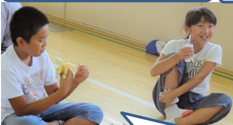
朝ごはんもみんなで。

○「学校にとまろう実行委員会」の皆さんを中心に、PTA、地域の皆様のご協力のおかげで、子どもたちの夏の思い出を演出することができました。ありがとうございました。