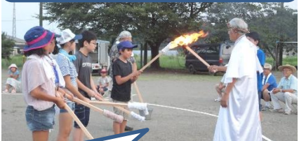
火の神様から、キャンプファイアーの火をいただく。