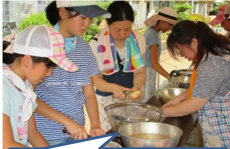
カレー作り。お家の方と一緒に作るのはいい経験です。