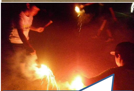
花火をみんなでやると楽しいね。