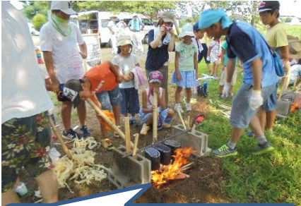
飯盒でご飯炊き。1年生も上手にマッチが擦れました。

○8/3(金)～4(土)、恒例の「学校にとまろう」がありました。その様子をご紹介します。