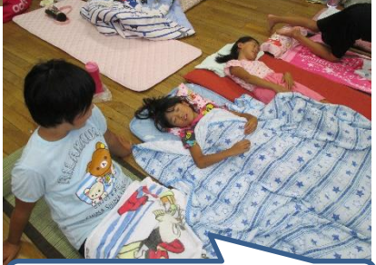
いい夢見よう。おやすみ～