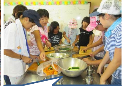
野菜などの食材も、地域の方からいただきました。