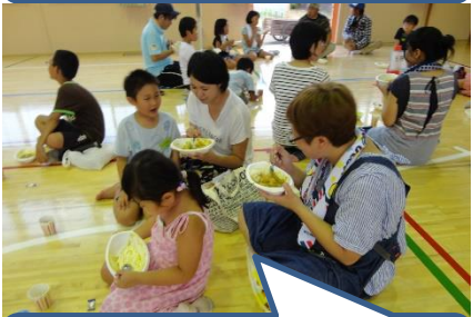
みんなでおいしく「いただきます」