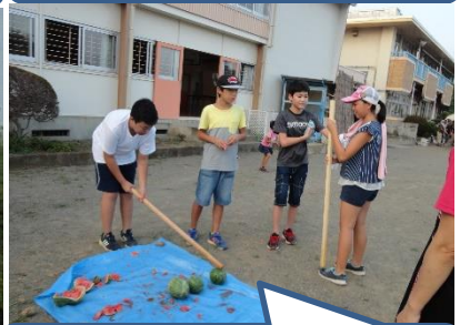
楽しいスイカ割り