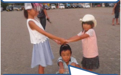
河上先生のキャンプファイアーのスタンツも楽しかった。