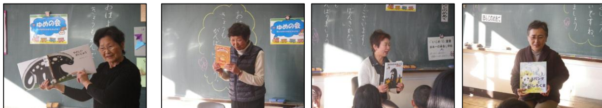
♡ ゆめの会の皆様による読み聞かせの様子 ♡

読み聞かせボランティアの「ゆめの会」の皆様や図書ボランティアの「かっぱに～ら」の皆様には、一年間大変お世話になりました。