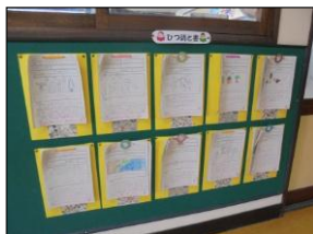
【2年生の必読図書コーナー】

今、必読図書読破のため、全児童が積極的に取り組んでいます。 1、3、4年生がすでに読破をしていますが、他の学年でも朝読の時間を使って読破を目指しています。 あともう少しで達成できそうな児童がたくさんいます♪