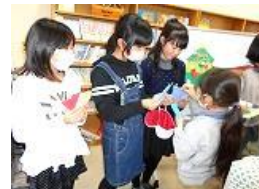
【好きな色を2色選びました。絵柄はお楽しみ☆】