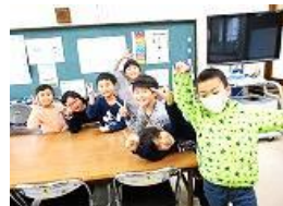
【一番最初に並んだ2年生】