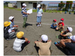
【国府南っ子タイム】