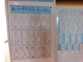
【歯の衛生週間・標語】