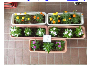
【星風会へのプレゼント】