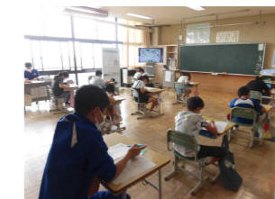
【中学生の職場体験】