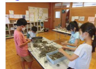
【ルピナスの種取り】