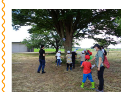
【1・2年生国庁跡で虫取り】