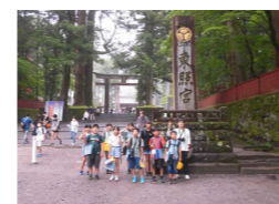
【6年生日光へ校外学習】