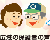
広域の保護者の声

先生方の目が行き届いているので、安心して学校に通わせることができます。勉強がわからないときは個別に指導していただけるので、とても助かっています。全校児童の仲がよく、上級生が下級生の面倒を見られるのも素晴らしいと思います。