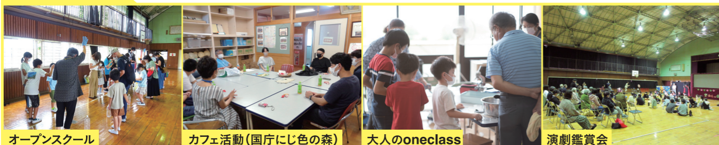
オープンスクール | カフェ活動(国庁にじ色の森) | 大人のoneclass | 演劇鑑賞会