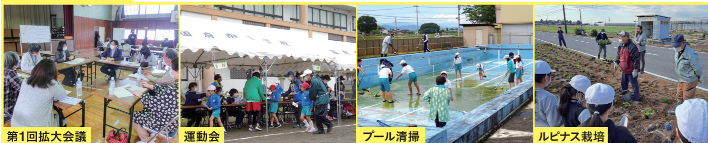
第1回拡大会議 | 運動会 | プール清掃 | ルビナス栽培