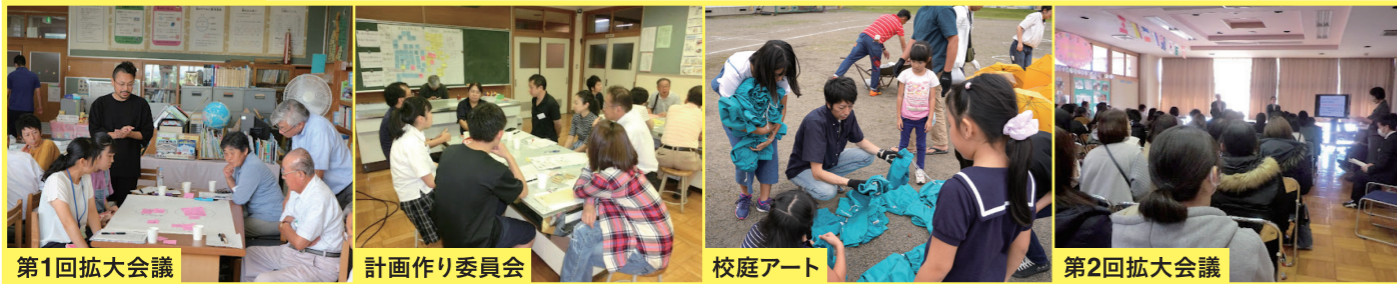
第1回拡大会議 | 計画作り委員会 | 校庭アート | 第2回拡大会議