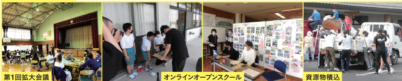
第1回拡大会議 | オンラインオープンスクール | 資源物積込