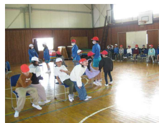
【国府南っ子タイム】 椅子取りゲーム