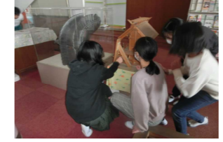
【6年企画最後の南っ子タイム】 協力して探し物を見つけました。最後の企画もみんなで盛り上がりました。6年生ありがとうございました。