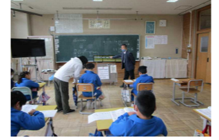
【3年珠算教室】 講師の先生から、そろばんの使い方や計算の仕方を教えていただきました。