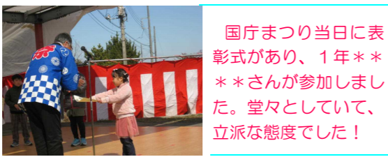
国庁まつり当日に表彰式があり、1年****さんが参加しました。堂々としていて、立派な態度でした!