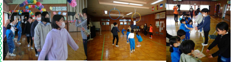
【6年生を送る会】 5年生が中心となり、なかよし班で活動する内容を考え、みんなで協力して楽しい時間を過ごしました。最後にプレゼントを渡して6年生への感謝の気持ちを伝えることができました。