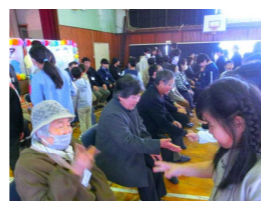
【自己紹介ジャンケン】

学校支援ボランティアとしてお世話になっている方々をお迎えして、感謝の会を開催しました。全校児童の合唱や、高学年による国府太鼓の発表を通して一人一人が感謝の気持ちを伝えました。多くの方々に教育活動に関わっていただくことで、子どもたちは楽しく安全な学校生活を送ることができています。心より感謝申し上げます。