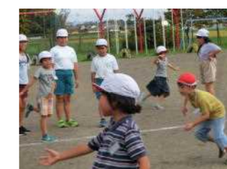
【国府南っ子タイム：全校児童でだるまさんの一日を実施】