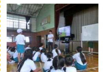
【EXPOタイム：ドイツ編 後半はゲームにも挑戦！】