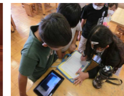
タブレットも活用