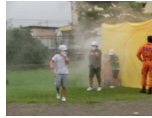
【避難訓練：煙体験、消火器の使い方や防火衣着用など、たくさんのお話を学びました】