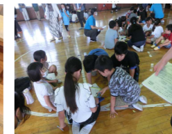
みんなで話し合い