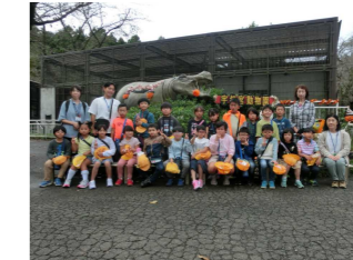
【1・2年校外学習：宇都宮動物園へ】