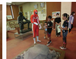
コンポストマンも協力