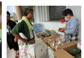
新鮮野菜のバザー