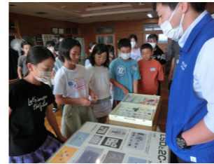
【5、6年薬物乱用防止教室】