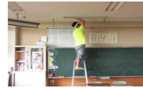
【蛍光灯清掃・交換】

P T A奉仕活動には、暑い中、多くの保護者の皆様にご参加いただきありがとうございました。日頃行き届かない校舎内の清掃をしていただき、とてもきれいになりました。児童も、校庭や学年農園の除草に一生懸命取り組みました。しっかり熱中症対策をとっていただけたので、無事に終了することができました。皆様のご協力のおかげで、気持ちのよい環境で学校生活を送ることができています。ご協力ありがとうございました。