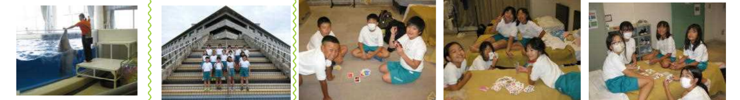
アクアワールド 全員でショー見学