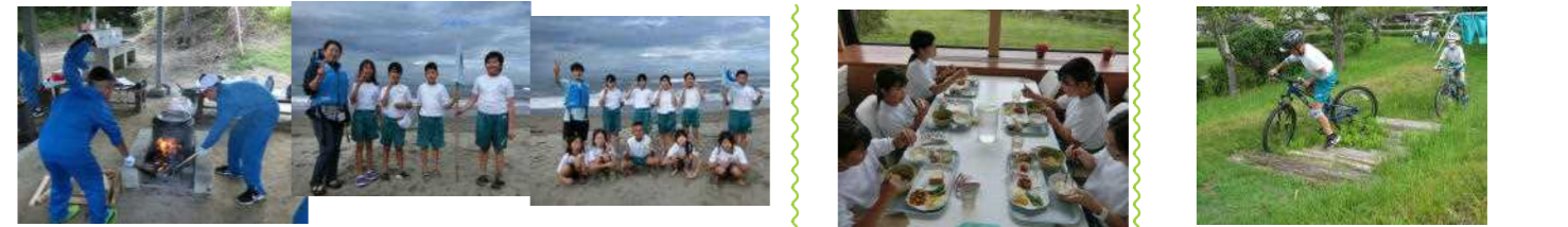
塩づくり、砂浜活動、みんなで協力してできました